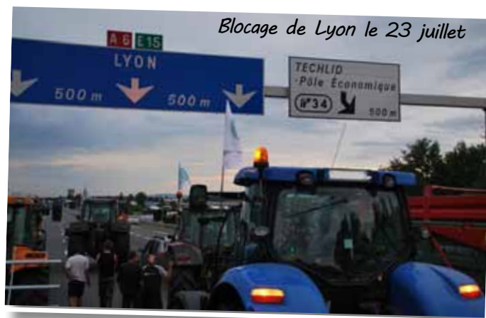
Blocage de Lyon le 23 juillet