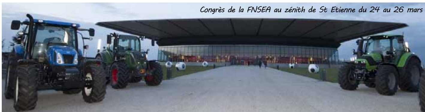
Congrès de la FNSEA au zénith de St Etienne du 24 au 26 mars